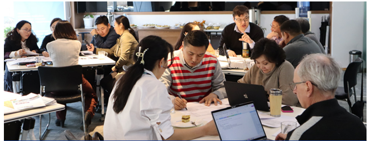
Зураг 3. Төлөвлөлтийн багийн мэргэжилтнүүд хяналт-шинжилгээний хүрээ тодорхойлохоор багаар ажиллаж буй нь

Төлөвлөлтийн багийн мэргэжилтнүүд Салхитын уурхайн хаалтын нөхөн сэргээлтийн гүйцэтгэлийг үнэлэх хүрээ, хяналт-шинжилгээний шалгуур үзүүлэлтүүдийг тодорхойлох зорилгоор нийт гурван удаагийн багийн хэлэлцүүлгийг зохион байгуулав. Олон улсын техникийн зөвлөх Канадын Алберта мужид ижил төстэй төслүүдийн хаалтын төлөвлөгөө боловсруулахад оролцсон туршлагын дагуу хяналт-шинжилгээний шалгуур үзүүлэлтүүдийг боловсруулав.