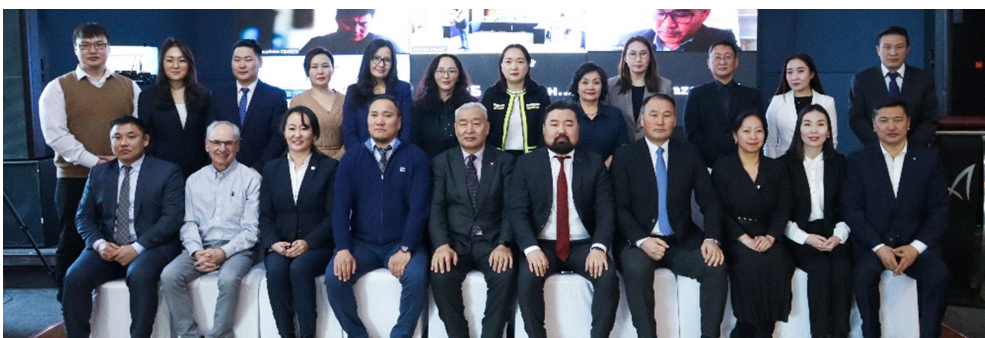
Зураг 2. Жишиг төслийн гол оролцогч талуудын 2023 оны 2-р сарын уулзалтад оролцсон төлөөлөл

Хаалтын газар хэлбэршүүлэлтийн инженерийн зураг төслийг нөлөөлөлд өртсөн талбайг байгалийн унаган төрхөд ойртуулж, нутгийн иргэдийн уламжлалт газар ашиглалтад нийцүүлэн нөхөн сэргээх хэмээн жишиг төслийн эхний үе шатанд тодорхойлсон хаалтын үндсэн хоёр зорилгод нийцүүлэн боловсруулаад байна. Чингэхдээ уурхай хаагдсаны дараа нөхөн сэргээсэн газар нутаг урт хугацаанд тогтвортой үр өгөөж бий болгоход анхаарч, сүүлийн таван сарын хугацаанд хаалтын төлөвлөлтийн багийн нарийн мэргэжлийн зөвлөх тус бүрийн саналыг тусгаж боловсруулав. Уулзалтын үеэр газар хэлбэршүүлэлтийн инженерийн зураг төслийг оролцогч талуудад танилцуулж, санал зөвлөмжийг нь сонсов.