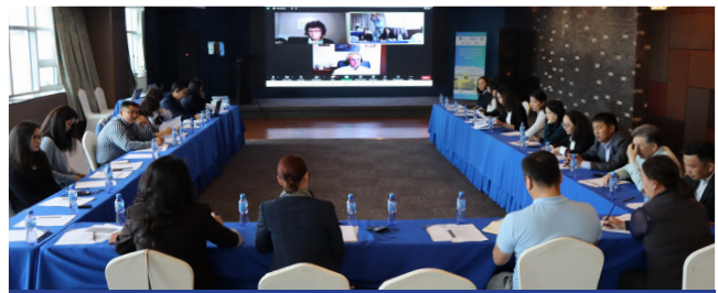
Үндэсний зөвлөхүүдэд чиглэл өгөх уулзалт