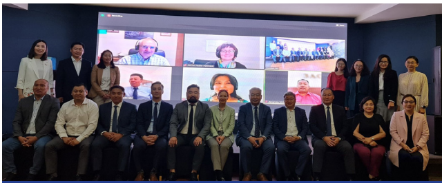
Жишиг төслийн 2-р үе шатны нээлтийн хурал