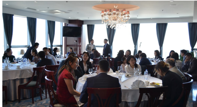
“Шинэ өглөө, Шинэ санаа” VIP өглөөний цай, нетворкинг арга хэмжээний үеэр. 2019 оны 5-р сарын 30