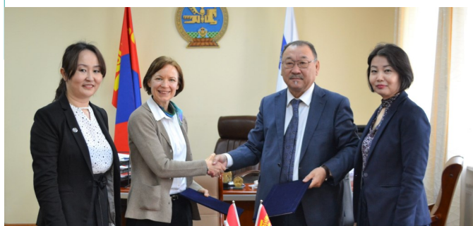
MERIT төсөл болон БОАЖЯ "Манлайлах урлаг ба жендерийн мэдрэмж" сэдэвт сургалтын хөтөлбөрийн хүрээнд хамтран ажиллахаар тогтлоо. 2019 оны 5-р сарын 16

2019 оны 5-р сараас 12-р сар хүртэл хэрэгжих тус хөтөлбөр нь байгаль орчин, аялал жуулчлалын салбарын удирдах албан тушаалтан болон албан хаагчдын манлайллын ур чадварыг бэхжүүлэх замаар удирдах чадварыг нэмэгдүүлэн, ажлын байрны чанарыг сайжруулж, бүтээлч, ая тухтай, жендерийн мэдрэмжтэй ажлын байрыг бий болгон иргэн төвтэй төрийн үйлчилгээг хэрэгжүүлэхэд чиглэсэн юм.