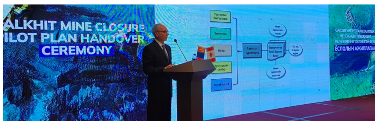
Зураг 3: Ёслолын ажиллагааны үеэр Салхитын уурхайн ХМТ-ний жишиг төслийн ахлах зөвлөх СиПиПи Энвйронментал корпорацийн ерөнхийлөгч Майк Посенте нь Уурхайн хаалтын төлөвлөлтийг Монгол улсын Уул уурхайн салбарт хэрэгжүүлэх талаарх зөвлөмжийг танилцуулж байна.

Жишиг төслийн хүрээнд MERIT төслөөс “Уурхайн хаалтын төлөвлөлтийг Монгол улсад хэрэгжүүлэх зөвлөмж” бүхий тайланг боловсруулж, 2023 оны 7-р сард холбогдох төрийн байгууллагын төлөөллүүд болон бусад оролцогч талуудад танилцуулсан билээ. Уг тайланд Төрийн захиргааны төв болон нутгийн захиргааны байгууллагууд, уул уурхайн компаниуд, иргэд, сургалтын байгууллагууд, үндэсний зөвлөх компаниуд зэрэг нийт таван шатны оролцогч талуудад зориулсан зөвлөмжийг багтаасан. Учир нь эдгээр оролцогч талууд нь Монгол улсын уул уурхайн салбарт Уурхайн хаалтын төлөвлөлтийг нэвтрүүлж, хэрэгжүүлэхэд чухал үүргийг гүйцэтгэх юм.