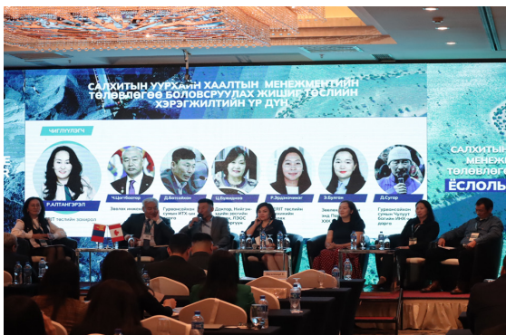
Зураг 2: Салхитын уурхайн ХМТ боловсруулах жишиг төслийн хэрэгжилтийн үр дүн - Панел хэлэлцүүлэг

Тус чуулганы үеэр ХМТ-ний жишиг төслийн явцад олж авсан сургамж, үр дүн болоод цаашид хаалтын төлөвлөлтийг урт хугацаанд хэрхэн тогтвортой хэрэгжүүлж, төлөвшүүлэх талаарх салбарын бодлого зэрэг үндсэн хоёр сэдвийн хүрээнд панел хэлэлцүүлэг өрнүүлэв. Хэлэлцүүлгийн үеэр нөлөөллийн бүс буюу Дундговь аймгийн Гурвансайхан сум болон Чулуут багийн иргэдийн төлөөллүүд уурхайн хаалтын болон хаалтын дараах үеийн нийгэм, эдийн засгийн шилжилттэй холбоотой өөрсдийн санал болоод санаа зовниж буй асуудлуудаа илэрхийлж байв.