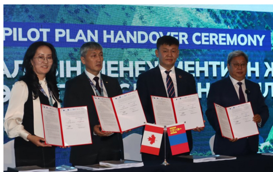
Зураг 1: MERIT төсөл нь Салхитын уурхайн хаалтын менежментийн жишиг төлөвлөгөөг УУХҮЯ, БОАЖЯ, Эрдэнэс Силвер Ресурс ХХК-д хүлээлгэн өгөх дөрвөн талт Санамж бичигт гарын үсэг зурлаа.

Чуулганы гол зорилго нь жишиг төслийн хүрээнд боловсруулсан Салхитын уурхайн Хаалтын менежментийн төлөвлөгөөг MERIT төслөөс Эрдэнэс Силвер Ресурс (ЭСР) ХХК-д албан ёсоор шилжүүлж, цаашид төлөвлөгөөг шинэчлэх, хэрэгжүүлэх, батлуулах зэрэг ажлууд нь тус компанийн хуулиар хүлээсэн үүрэг, хариуцлага болохыг мэдэгдэв. Түүнчлэн уурхайн хаалтын төлөвлөлтийг уул уурхайн салбарт үр дүнтэй хэрэгжүүлэх туршлага, стратеги бүхий зөвлөмжүүдийг төрийн албан хаагчид болон салбарын оролцогч талуудад танилцуулж, санал нэгдэв.