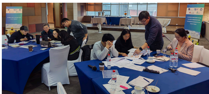
Зураг 2. Газар хэлбэршүүлэлтийн багийн ажил №6. 2022.11.15