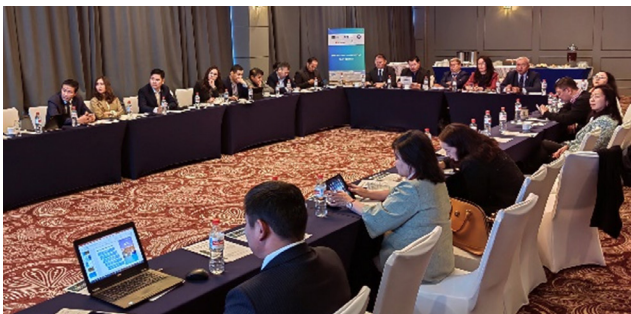
Зураг 3. 2022 оны 11 сарын 22-нд болсон төслийн оролцогч талуудын ээлжит уулзалал

суралцаж, “Эрдэнэс Монгол” ХХК-ийн нийт 20 охин компанид төслийн сайн туршлагыг нэвтрүүлэхийг эрмэлзэж байна. Удирдах зөвлөл хаалтын зардлыг компанийн бизнес төлөвлөгөөнд үе шаттай тусгаж, тогтвортой байдлыг хангаж ажиллана” гэв.