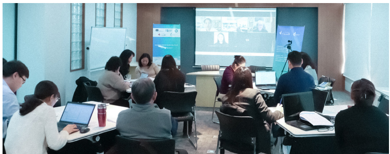
Зураг 2. Хаалт, нөхөн сэргээлтийн өртөг, зардал тооцоолох 3 дахь удаагийн хэлэлцүүлэг

Гуравдугаар сарын 1, 16-ны өдрүүдэд өртөг зардал тооцоолох хоёр, гурав дахь удаагийн хэлэлцүүлэг боллоо. Хэлэлцүүлэгт төлөвлөлтийн багийн мэргэжилтнүүд болон “Эрдэнэс Силвер Ресурс” ХХК-ийн санхүүгийн баг оролцов. Зардал тооцоолох багийн гаргасан удирдамж, загварын дагуу мэргэжилтнүүд газар хэлбэршүүлэлт, нөхөн сэргээлт, дэд бүтцийг татан буулгах, байгалийн унаган төрхөд нийцүүлэн нөхөн сэргээхэд шаардагдах өртөг зардал, хуваарийг гаргахаар ажиллаж байна. “Эрдэнэс Силвер Ресурс” ХХК-ийн санхүүгийн алба хаалтын өртөг зардал тооцоолох ажлын бүх үе шатанд оролцож, зардал тооцоолох зөвлөх багтай нягт хамтран ажиллаж байна. Хаалтын зардал тооцоолох нэмэлт хэлэлцүүлэг зохион байгуулж, нарийвчилсан төлөвлөгөөг дөрөвдүгээр сарын сүүл гэхэд эцэслэн гаргаж, “Эрдэнэс Силвер Ресурс” ХХК-д танилцуулан батлуулахаар төлөвлөж буй.