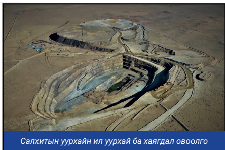
Салхитын уурхайн ил уурхай ба хаягдал овоолго

Дараах зургуудаар Салхитын ордын ил ухаш, хаягдлын сан, хаягдал овоолго болон хүдэр баяжуулах үйлдвэрийг харуулав.