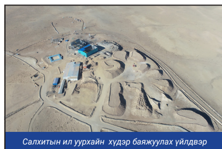
Салхитын ил уурхайн хүдэр баяжуулах үйлдвэр

Салхит уурхайн өнөөгийн байдал, тоо баримтаар: