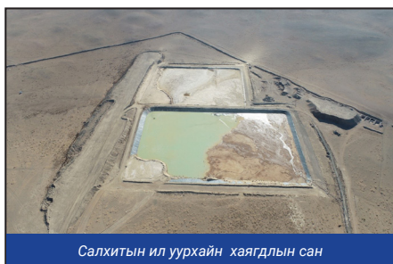
Салхитын ил уурхайн хаягдлын сан