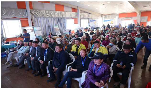
Зураг 1. Гурвансайхан сумын төвд болсон иргэдэд мэдээлэл өгөх нээлттэй хаалганы өдөрлөг

“Нээлттэй хаалганы өдөрлөг” хоёр өдрийн арга хэмжээний туршид хаалтын төлөвлөгөө боловсруулж буй үндэсний зөвлөхүүд өөрсдийн гүйцэтгэж буй ажил үүрэг, түүний ач холбогдлын талаар иргэдэд мэдээлэл өгч, сонирхсон асуултад хариулж, нээлттэй яриа өрнүүлэв. Иргэд байгаль орчин ба нөхөн сэргээлт, усны нөөц ба менежмент, нийгэм-эдийн засаг ба жендэр, хаалтын өртөг зардал тооцоолох, хууль эрх зүй, уур амьсгалын өөрчлөлт зэрэг үндэсний зөвлөхүүдийн болон “Эрдэнэс Силвер Ресурс” ХХК, MERIT төслийн өртөөгөөр зочилж, уурхайн хаалтын талаар цогц ойлголт, мэдээлэл авлаа. Өдөрлөгт оролцсон иргэд “Уг арга хэмжээнд оролцсоноор уурхайн хаалт гэдэг нь одоо хаах тухай биш 10 жилийн дараах хаалтыг одоо төлөвлөх тухай ярьж байгааг ойлгож авлаа”, “Уурхай хаалттай байсан, одоо нээлттэй болно гэж байгаад баяртай байна” хэмээн сэтгэгдлээ хуваалцав.