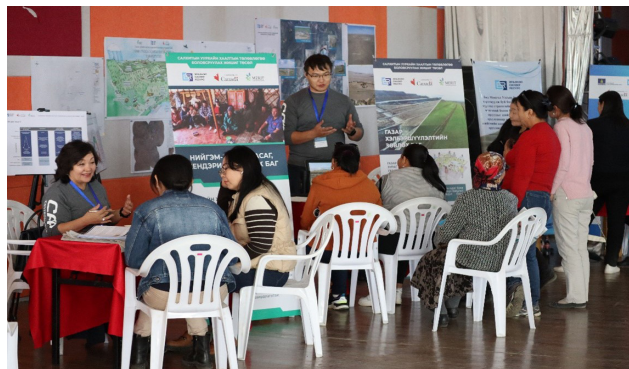
Зураг 2. Иргэд үндэсний зөвлөхүүдийн өртөөгөөр зочилж, уурхайн хаалтын талаар мэдээлэл авч, санал бодлоо хуваалцав.

Салхитын уурхайн хаалтын төлөвлөлттэй холбоотой санал хүсэлтээ бүлгийн хэлэлцүүлэгт оролцох, төлөвлөлтийн багийн зөвлөхүүдтэй уулзаж ярилцах, саналын хуудас бөглөх зэргээр өгсөн болно. Уурхайн хаалттай холбоотой иргэдээс ирсэн саналыг жагсааж, графикаар харуулав (Зураг 3-ыг харна уу).